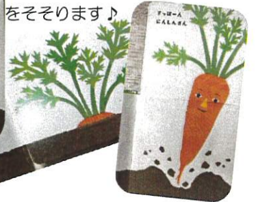
「やさいさん」シュールな絵が興味をそそります♪