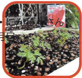
順調に生長しています！