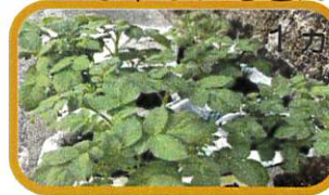
じゃがいもさん・にんじんさん 1ヶ月目