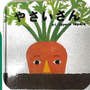
子ども達も楽しめるしかけ絵本