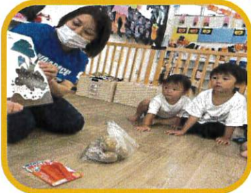
うわあ！やさいさんすごいなあ！