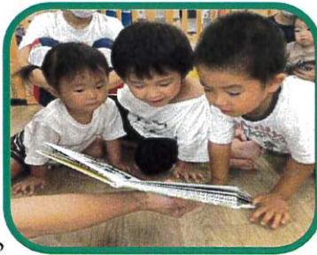
栄養士による読み聞かせ！ 子ども達は聞き入っていました♪