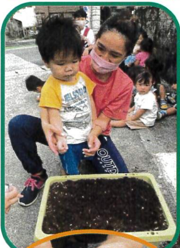
種をパラパラ… じゃがいもはそーとと…