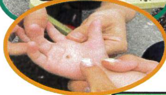
にんじんさんの種って ちいさいね♪