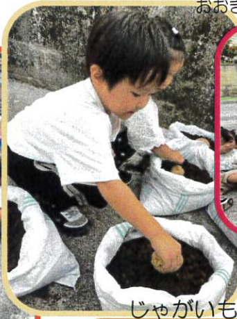
おおきくなあれ！のおまじないをしました♡