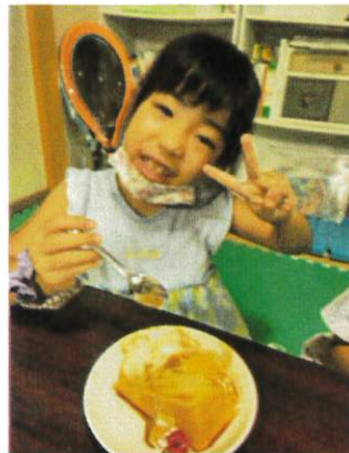
プリン大成功！美味しかったよ