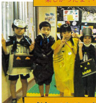
～似合ってるでしょう～