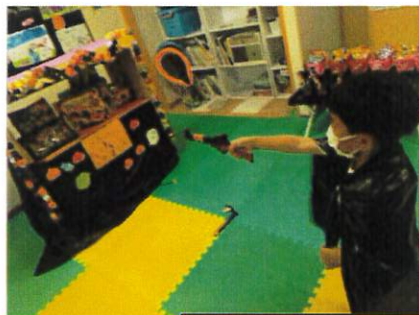
～楽しかったよ！ハロウィン祭り～