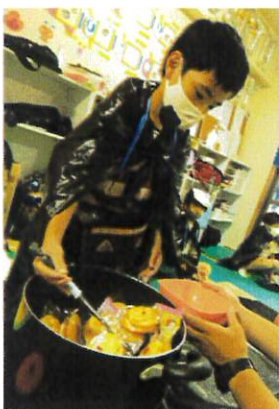
いっぱいとりえるかな