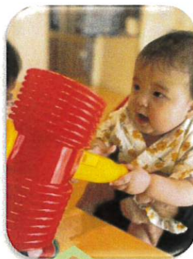
ワニワニパニック ワニさんをハンマーで叩くよ。 0歳児もとっても上手でした。