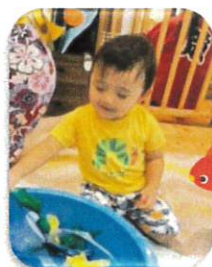
金魚すくい。オレンジ、きいろ、緑 どの金魚にしようかな

的当て カニの箱、目掛けて「エイ！」思い切り投げたり 近くに行き入れたり・・・ がんばった景品は紙のボウルで作ったヨーヨー でした。