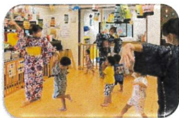
盆踊り みんなで輪になって 踊ったよ。

子どもたちに楽しんでもらおうとちゅら祭りとして夏祭りごっこを開催しました。朝から甚平を着て登園し、「見て～」と甚平姿を見せあう子もいたりワクワクな雰囲気でした。この日は職員も浴衣や法被を着て雰囲気を盛り上げました。