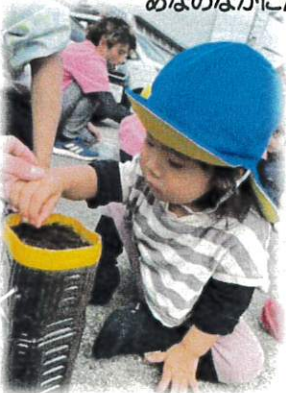
そーっとつちをかぶせて…