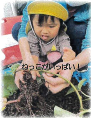
ねっこがいっぱい!

土遊びをしながら、6月に植えたサツマイモの収穫しました。その後、野菜の種を植えました。今回はジャガイモ、人参、大根です。大根はペットボトルを使って育てるため収穫が楽しみです♪