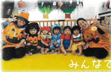
みんなでハイポーズ！

10月末に行った、ハロウィンパーティー♪近隣店舗や地域の方々の協力の元、子どもたちも、先生たちもみんなで楽しむことができました！たくさんのお菓子をもらい、満足気の子もたちでした♪