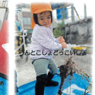
うんとこしょどっこいしょ