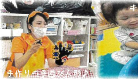
手作りの手遊がく形

パーティー当日の午後は先生たちの手作りゲームやダンスの出し物で楽しみました♪盛りだくさんの1日でした◎