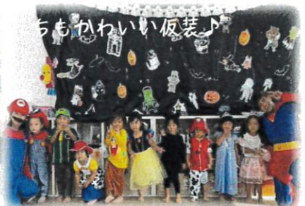
先生たちもかわいい仮装♪