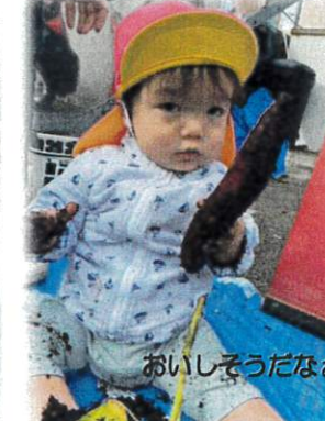
おいしそうだなあ