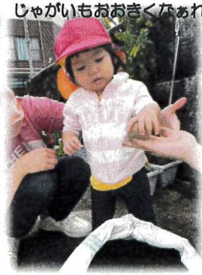
じゃがいもおおきくなあれ♪