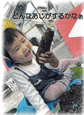
どんなあじがするかなあ?