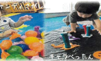
キャンディさがし