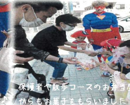
保護者や散歩コースのお弁当屋さんからもお菓子をもらいました