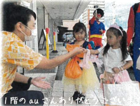
1階のauさんありがとうございました♪