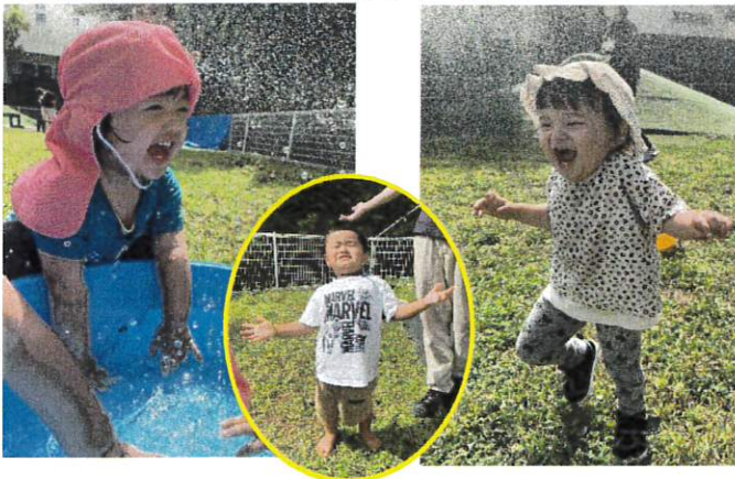
ホースからの水しぶきに喜ぶ子どもたち

慣らし保育中は天気が良く園庭に出る機会がたくさんあり大好きな園庭遊びや水に触れ、慣れるのも早いようです。