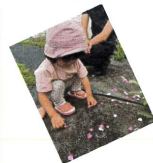
花びらの雨楽しいな。 もういっかいしようかな