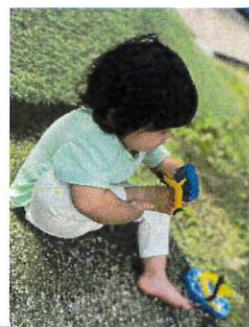
足指を動かして鼻緒 まで足指をいれてい くよ。しっかりと 草履を見ているね