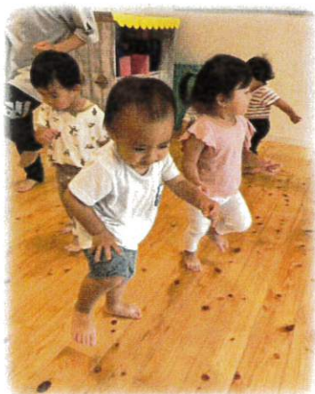
先生トンネル～ 上手にくぐるよ