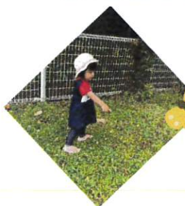
「ちょうちょ！」 ざるで捕まえられたかな

4月に入園した子たちも1ヶ月が経ち、子どもたちにも少しずつ変化が見られるようになってきました。園庭での活動を楽しみにし、朝も夕方も園庭で走り回る子どもたち。蝶を追いかけ自分で捕まえようとしたり、花を摘んでシャワーのように散らしたり、ままごとの見立てに使ったりと探索活動の中から「これなんだ」と自らかかわっていく姿にたくましさを感じます。