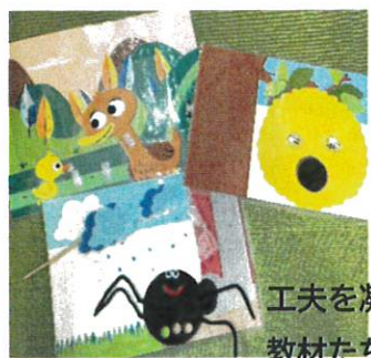
工夫を凝らした教材たち。これから増える予定です。