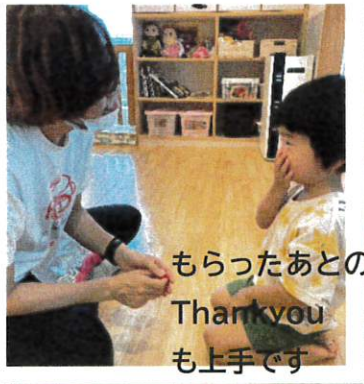
もらったあとのThank youも上手です