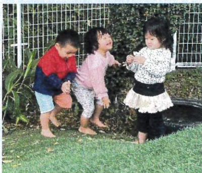
枯葉を見つけては「え〜い」と降らせて楽しむ3人組。子どもたちだけでもあそびが成立するようになりました。

今年度もまもなく終了ですね。4月の頃と比べ子どもたちもずいぶんたくましくなりました。今回は戸外での遊びの様子をお伝えします。