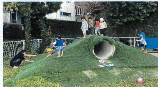
園庭にある芝山は滑り台になり、いろんな滑り方で楽しめるようになっています。