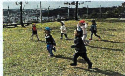
近くの広場の公園では思い切り走る子どもたち走るスピードも速くなっていますよ。