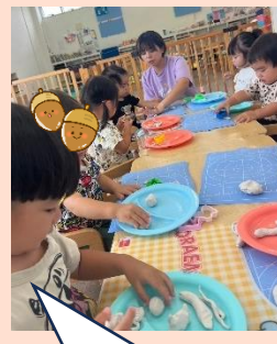
粘土を丸めたり ちぎったり (1歳児)