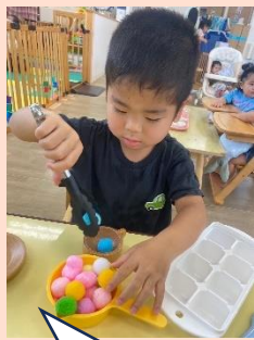
トングを使って はさめたよ！