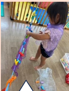
お洗濯遊びをとおして！

子ども達は、遊びを通して、たくさんの事を学びます。特に、0～2歳は手指の発達に関しても爆発的な成長を遂げます。手指の発達は経験を重ねることでどんどん磨かれていき、実際の生活の中でも、生かし、つなげています。いろいろ保育園でも、遊びの中で、『入れる、通す、はめる、押す、貼る、引く、つまむ、ひねる、持ち替える』がたくさん、経験できるように手指遊びを取り入れています。物と関わりながら、手指をなめらかに使いこなし、思考力を発揮している子ども達。(真剣な表情が物語っています！) 私達は手指遊びを大事に考えており、これからも子ども達の経験を助けるように努めていきたいと思っています！